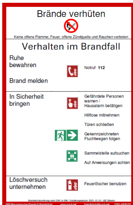
Abb.: Aushang der Brandschutzordnung Teil A

Die Brandschutzordnung Teil A ist in den Flucht- und Rettungsplänen integriert.